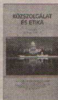
KÖZSZOLGÁLAT ÉS ETIKA Gulyás Gyula

A kötet első fele az általános elméleti kérdéseket taglalja, a további tanulmányok a közszolgálat morális dilemmáival, a politikai döntések kapcsán felmerülő értékkonfliktusokkal és a politikai adminisztrációs szféra felelősségével foglalkoznak.